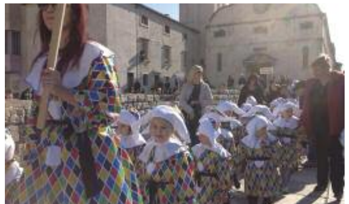
I bimbi del "Pinocchio" durante il carnevale vestiti da Arlecchino nei pressi della chiesa di Santa Maria

Questo è il fiore che oggi noi piantiamo insieme e, ne siamo certi, negli anni futuri diverrà un bell'albero."