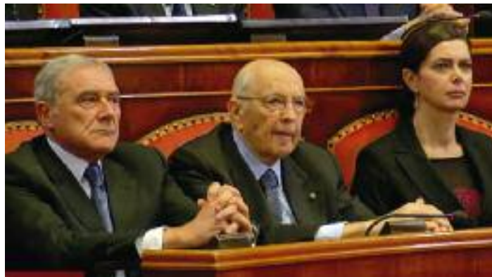
Il Presidente della Repubblica Giorgio Napolitano, il Presidente del Senato Pietro Grasso e la Presidente della Camera Laura Boldrini

Durante le lunghe e piacevoli continua a pag. 2