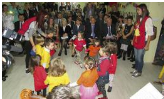
Girotondo dei bambini il giorno dell'inaugurazione dell'asilo alla presenza delle autorità e di un folto pubblico.

Liburnica, romana, bizantina, poi latina e slava insieme, infine veneta e italiana fino al 1947 ed oggi croata. Ma è la stessa città. Nessuno può impedire agli italiani esuli da Za-